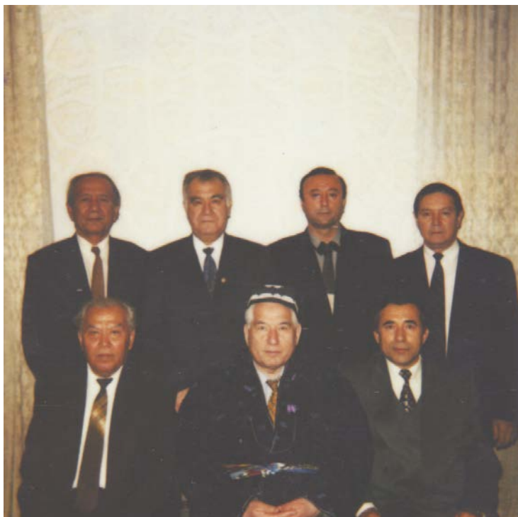
Сүрөттө: Кыргыздын залкар жазуучусу Чынгыз Айтматов Өзбек элинин атактуу даңктуу жазуучулары менен. Ташкент 2000-жыл.