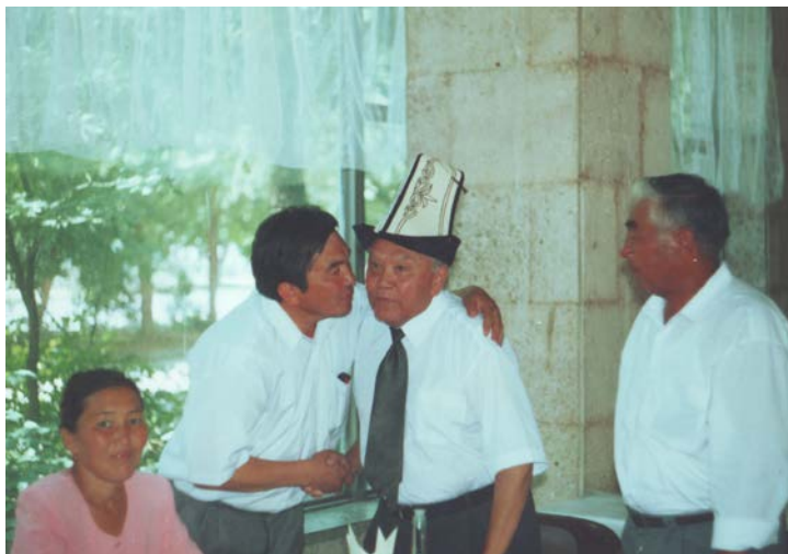
Сүрөттө: Өзбек Республикасынын эл жазуучусу Адыл Якубов, акын-котормочу Жакыпбек Акимов менен.