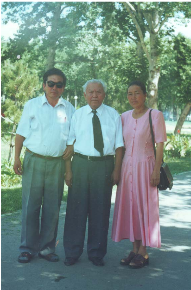
Сүрөттө: Өзбек Республикасынын эл жазуучусу Адыл Якубов, акын-котормочу Жакыпбек Акимов жана акындын өмүрлүк жары Үрниса Акимовалар Ташкөнт шаарында экскурсияда.